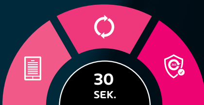
Abb.: Einfacher Onboarding-Prozess in drei Schritten

Mit 365 Total Protection schöpfen Sie das volle Potenzial Ihrer Microsoft Cloud Dienste aus.