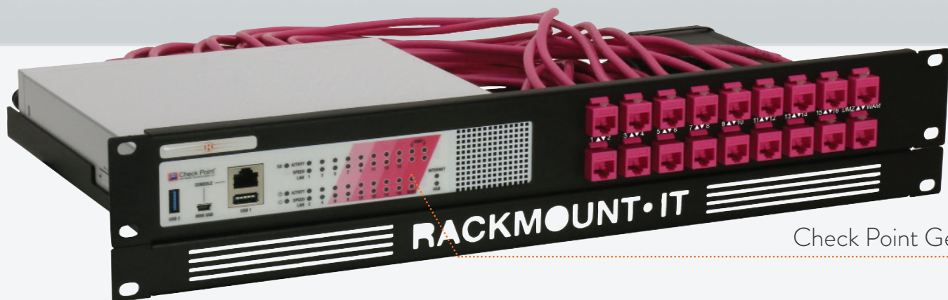
Check Point Gerät

MAßE 1.3U/2U FARBE RAL 9005 Schwarz PAKETMAßE 4.33 in. x 20.87 in. x 10.63 in. 11 x 53 x 27 cm PRODUKTMAßE 2.32 in. x 18.98 in. x 8.54 in. 59 x 482 x 217 mm (Höhe x Breite x Tiefe)