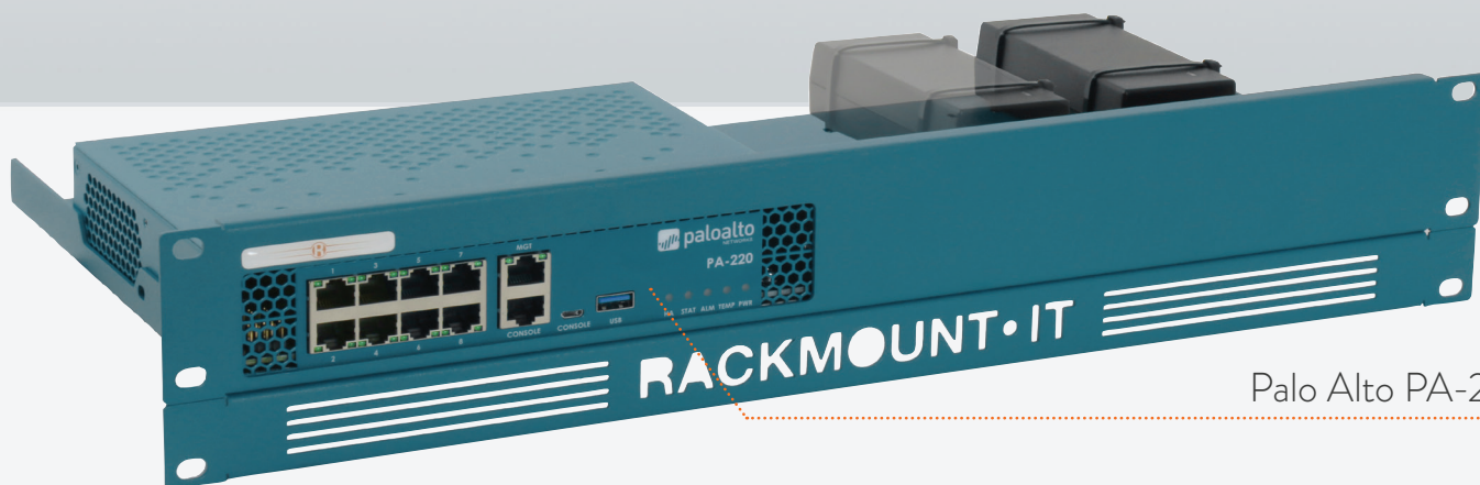
Palo Alto PA-220

MONTIEREN SIE IHREN PALO ALTO MIT DEM PA-RACK