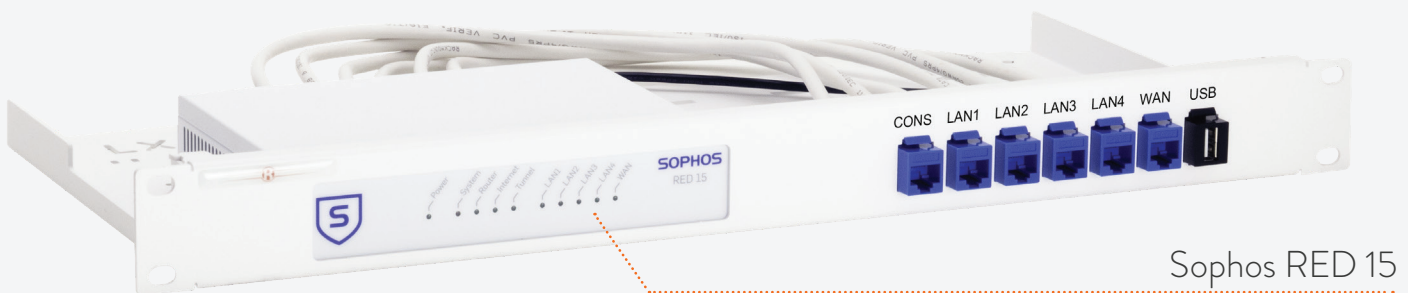
Sophos RED 15

MONTIEREN SIE IHREN SOPHOS MIT DEM SORACK